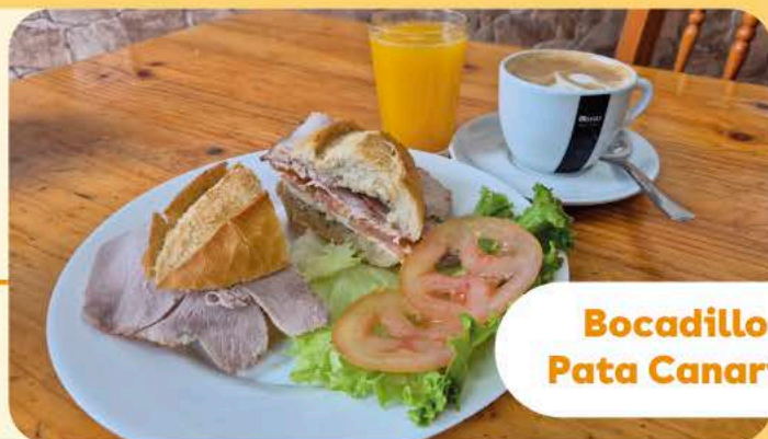
Bocadillo Pata Canario