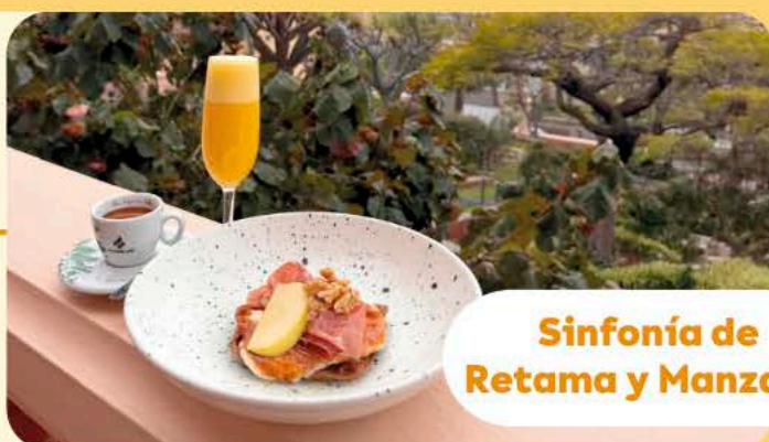
Sinfonía de Retama y Manzana